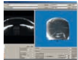
Berührungslos gemessen: Der Augendruck.

Sie messen sicher regelmäßig den Blutdruck. Aber wie hoch ist Ihr Augendruck? Zusammen mit der Kontrolle des Sehnervs eine wichtige Vorsorge Ihrer Augen Gesundheit. Bei Auffälligkeiten sind noch weitere Abklärungen notwendig.