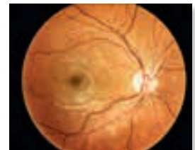
Fotodokumentation: Sehnerv und Netzhaut vergrößert.

Das Risiko eines Glaukoms (Grüner Star) und einer Macula-Degeneration steigt mit zunehmendem Lebensalter. Viele Krankheiten können um so besser behandelt werden, je früher sie erkannt werden. Daher kommt dem Netzhautscreening besondere Bedeutung zu.